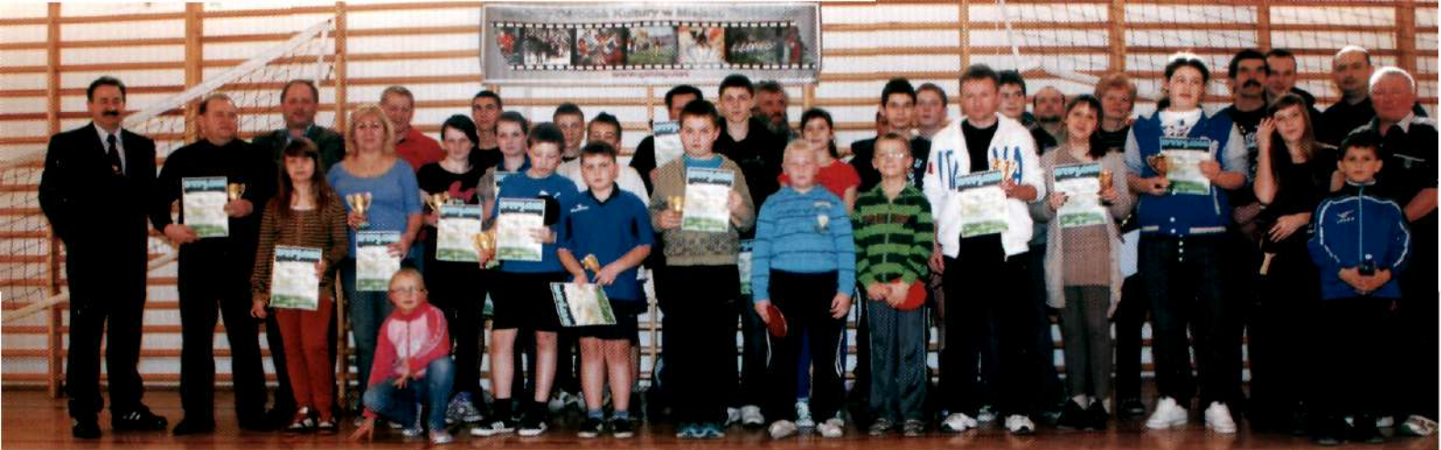
Uczestnicy Gminnego Turnieju Tenisa Stołowego