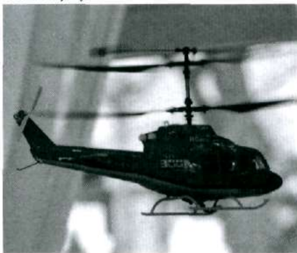
Przelatujący nad głowami zebranych helikopter wykonywał wydawane polecenia

wany przez firmę Model Hobby z Krosna. Przelatujący wielokrotnie nad głowami zebranych helikopter wykonywał wszystkie polecenia wydawane przez osobę sterującą. Atrakcją było również mini-plane-