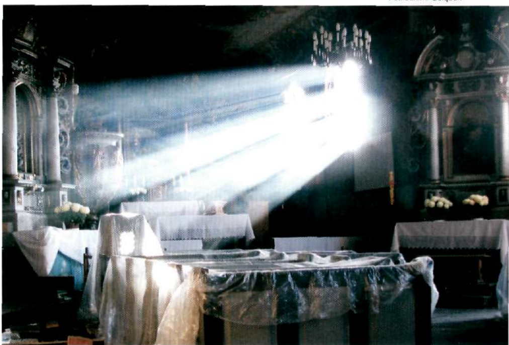
W miarę pozyskiwania środków przyjdzie czas na konserwację bardzo bogatego i cennego wyposażenia świątyni