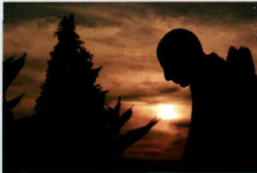
Jedna z cyklu prac, fot. Michał Stajniak z Miejsca Piastowego. I nagroda w kat. powyżej 16 lat