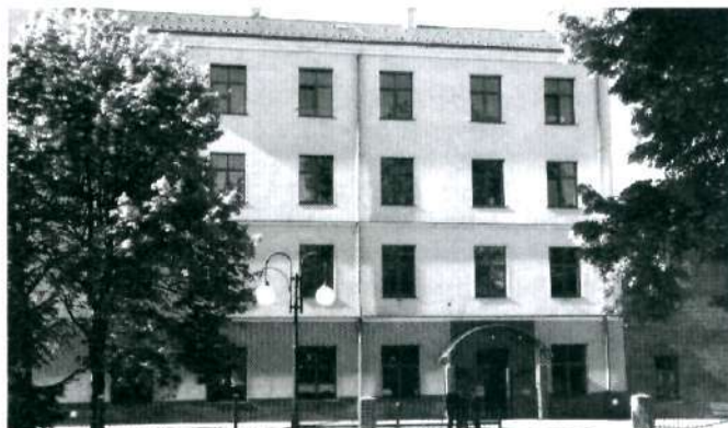
4 Powstanie nowe gimnazjum w Miejscu Piastowym