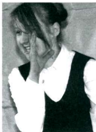
16 Gminny konkurs poezji