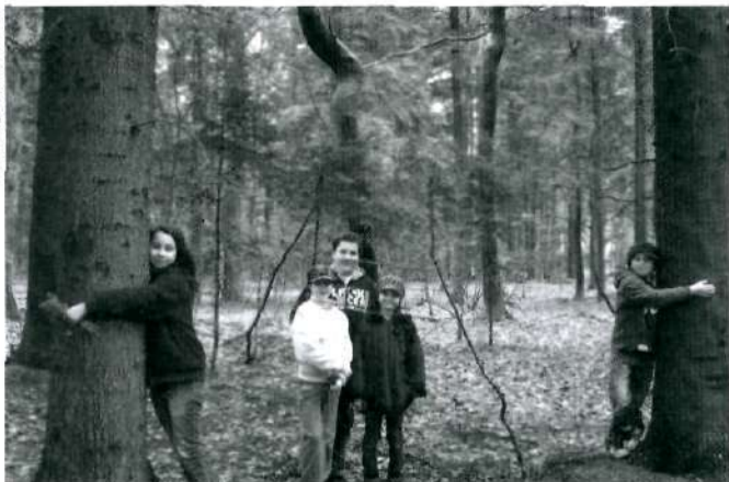
Widacz - Targowiska