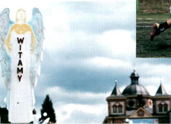
31 maja – Michayland w Miejscu Piastowym