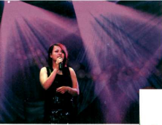
20 maja – Koncert galowy XVI Festiwalu Piosenki w Miejscu Piastowym

GMINNY OŚRODEK KULTURY w Miejscu Piastowym w najbliższym czasie proponuje: