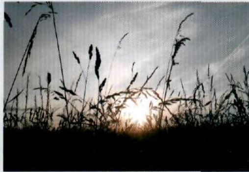
Fot. Paula Nadra z Miejsca Piastowego. Wyróżnienie w kat. do lat 16