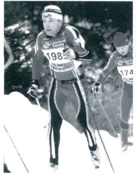
Na trasie we Włoszech

Chcąc zdobyć Worldloppet Master Medal trzeba zaliczyć dziesięć biegów w różnych krajach. Krótko mówiąc, kolejny start w Szwecji nie