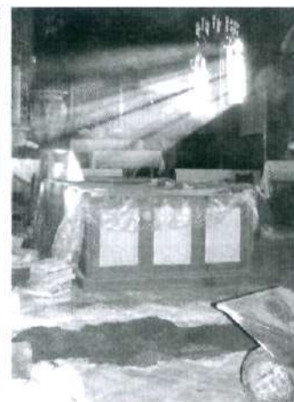
20 Remont kościoła w Rogach