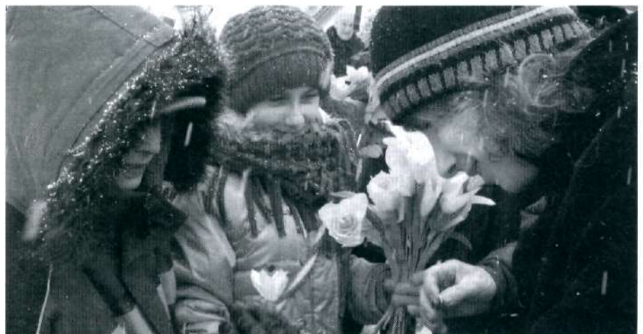
Pieniądze ze sprzedaży żonkili wspomogły krośnieńskie hospicjum