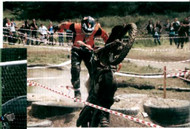
27 maja – I Puchar Polski "Extreme Enduro" na Winnej Górze