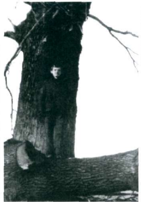
Po pożarze (koniec lat 70.) z dębu pozostał dwumetrowy pień

Wierni Głowienki, podobnie jak mieszkańcy innych podkrośnieńskich wiosek, przez wieki