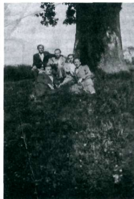
Pod dębem, 1944 r.