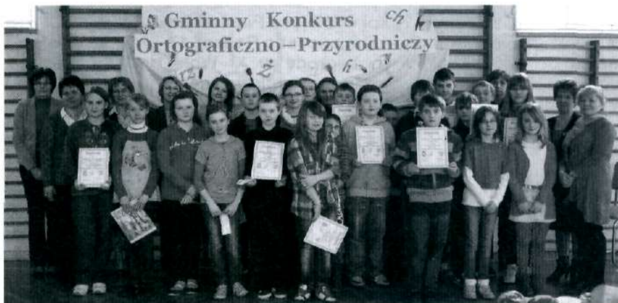
Uczestnicy konkursu wraz z opiekunami

Uczestnicy konkursu rywalizowali w sześciu konkurencjach. Musieli napisać krótki tekst na losowo wybrany temat, wymyśleć jak najwięcej nazw geograficznych z wylosowanymi literami, uzupełnić tabelę „państwa - miasta”, ułożyć pojęcia geograficzne w kolejności alfabetycznej, poprawnie napisać dyktando oraz rozwiązać krzyżówkę przyrodniczą. Zadania były ciekawe i urozmaicone, sprawdzały nie tylko umiejętności ortograficzne i wiedzę przyrodniczą, ale ćwiczyły umysł poprzez zabawę ze słowem oraz doskonaliły poprawną pisownię.