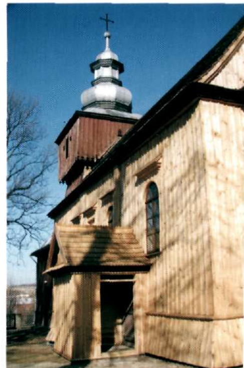
... i po remoncie

niczną i ekspertyzą konstrukcyjną. Ten etap kosztował 24 440 zł, z czego Urząd Gminy w Miejscu Piastowym pokrył znaczną część wydatków, tzn. kwotę 20 tys. zł. Pozostałą kwotę wpłaciło Stowarzyszenie Miłośników Wsi Rogi, Stowarzyszenie Przyjazna Szkoła