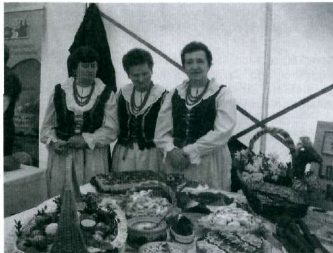
Panie z Rogów przygotowały bogato zastawiony stół wielkanocny.

Mieliśmy okazję obejrzyć to niespotykane w naszych stronach widowisko, ponieważ w poświęconej niedzielę, 15 kwietnia 2012 r., występowaliśmy w imieniu Lokalnej Grupy Działania Kraina - Nafty na Wojewódzkim Konkursie Wielkanocnym, który odbył się właśnie w Grodzisku Dolnym. Konkurs był skierowany do Lokalnych Grup Działania, których przedstawiciele mieli okazję do zaprezentowania swoich bogatych tradycji związanych z Wielkanocą. Nasze LGD reprezentowali mieszkańcy Rogów. Panie przygotowały bogato zastawiony potrawami świątecznymi stół wielkanocny i koszyk tradycyjnie zdobionych woskiem i malowanych w kolorach pisanek. Oczywiście w koszyku, oprócz malowanych pięknie jaj, były wszystkie pokarmy, które w naszych stronach święcimy w Wielką Sobotę. Poczesne miejsce zajmował chleb (żeby go nigdy nie brakowało w domach), który był zawsze podstawą pożywienia. W centralnym punkcie kosza stał baranek wielkanocny, symbolizujący Chrystusa Zmartwychwstałego. Tym