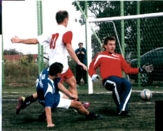
27 maja - I Gminny Amatorski Turniej Piłki Nożnej w Rogach