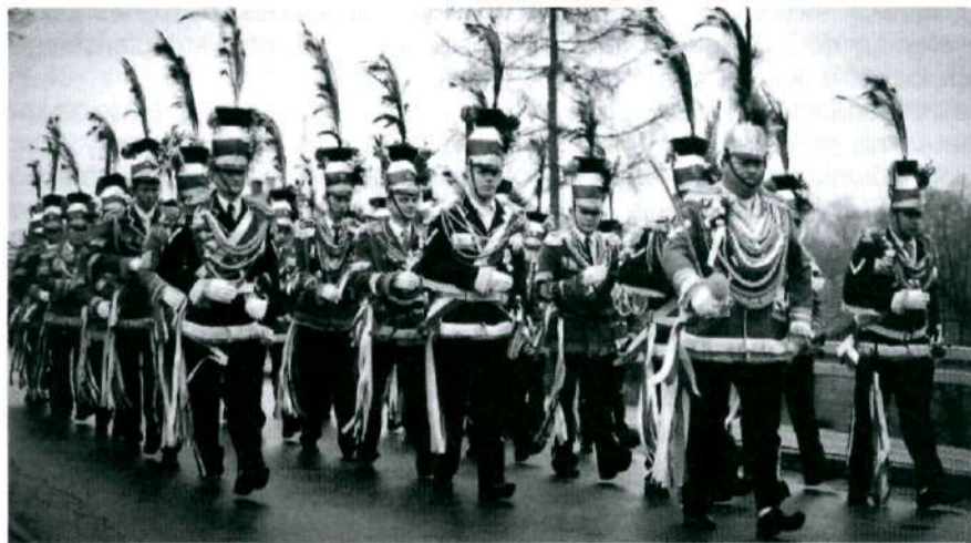
W paradzie wzięło udział ponad czterdzieści oddziałów Turków

razem zrobiony z masła, z przyczepioną chorągiewką, która oznacza zwycięstwo nad śmiercią. W koszu znajdował się oprócz tego ser upieczony w postaci gomółki i chrzan z octem. Chrzan swoim ostrym zapachem i smakiem ma wyciskać przy śniadaniu wielkanocnym łzy z oczu, byśmy pamiętali o męce i śmierci naszego Odkupiciela. Octem pojono na krzyżu Jezusa i na tę pamiątkę dawano go do święconego . Sól, którą święcimy wraz z pokarmami, ma nas bronić od wszystkiego złego. Dodawano ją później do niektórych przygotowywanych potraw, przez co były święcone. Była też w koszyczku mała butelka z oliwą, bo jej krople symbolizowały modlitwę Jezusa w Ogródzie Oliwnym. Koszyk nasz był przystrojony kwiatami i zielonym zbożem, by baranek miał się gdzie paść ... Kosz, jak każda tradycja, przykryto piękną, wykrochmaloną, ręcznie robioną serwetką.