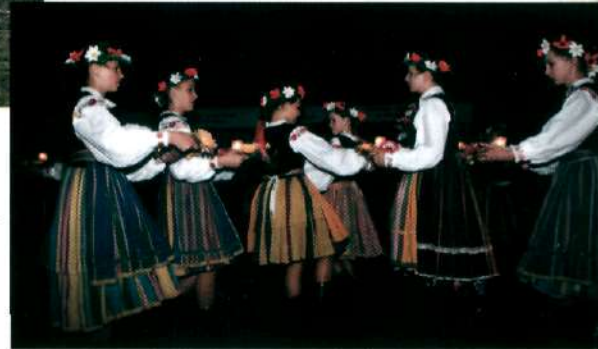
23 czerwca – Wianki w Niżnej Łące