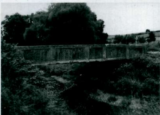
Most nad Lubatówką. III miejsce w kat. powyżej 16 lat