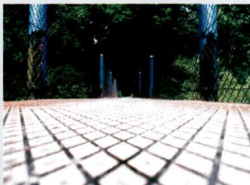
Lustrzane odbicie. Wyróżnienie w kat. powyżej 16 lat

W twoim spojrzeniu. II miejsce w kat. powyżej 16 lat